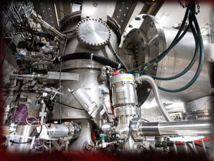
世界有数の多価イオン源Tokyo-EBIT